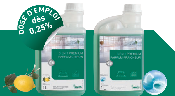
Parfum Citron (parfum de synthèse)